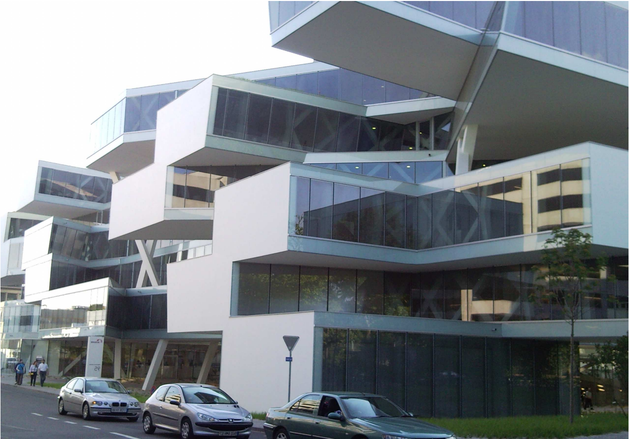
Actelion's Business Center, Allschwil, 2005-2010

of their home field advantage and realised a variety of projects in Basel, Münchenstein, Weil am Rhein and St. Louis. A tour of inspection to some of their local project sites.