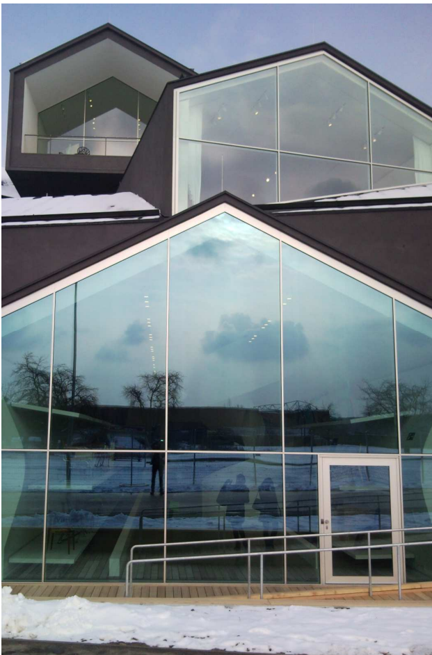
VitraHaus, Weil am Rhein, 2006-2009

*Sportzentrum Pfaffenholz, St. Louis, 1992-1993