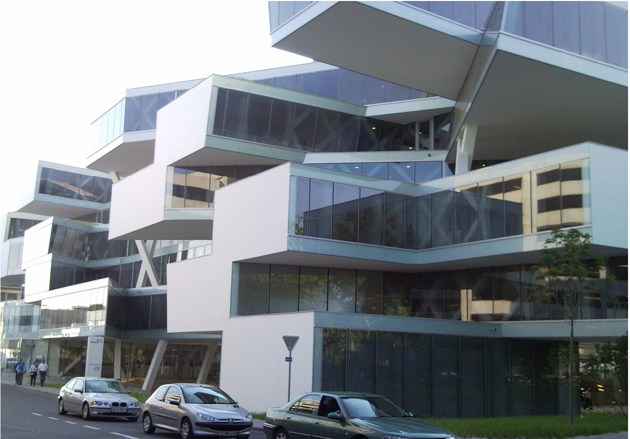
Actelion's Business Center, Allschwil, 2005-2010

home field advantage and realised a variety of projects in Basel, Allschwil, Weil am Rhein and St. Louis. A tour of inspection to some of their local project sites.