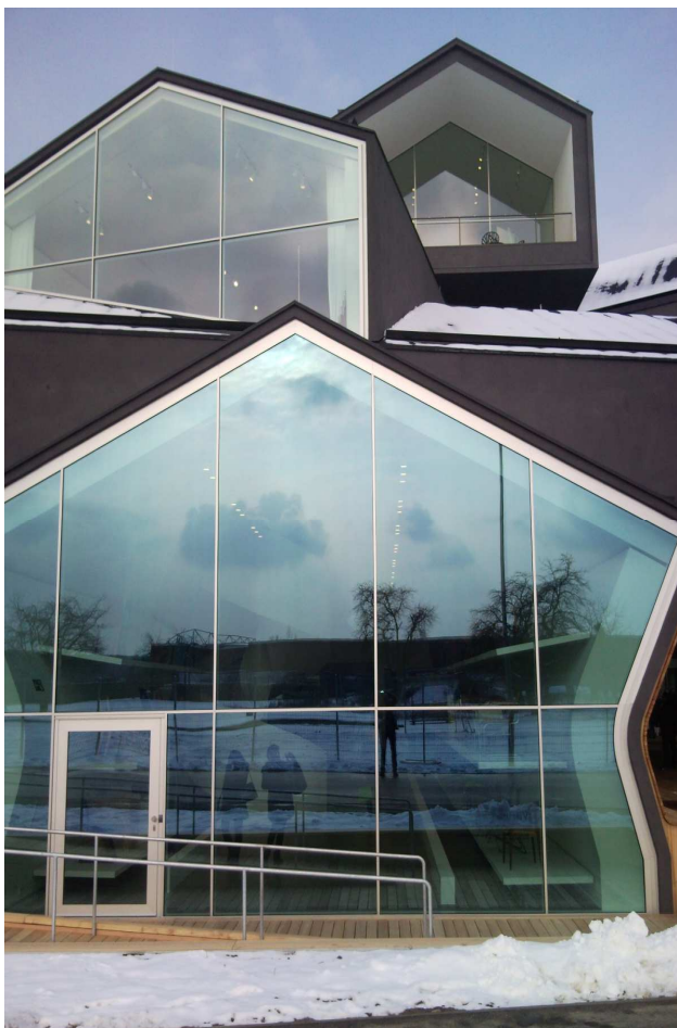
VitraHaus, Weil am Rhein, 2006-2009

*Sportzentrum Pfaffenholz, St. Louis, 1992-1993